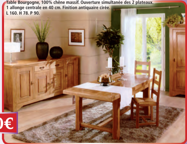
Table Bourgogne, 100% chêne massif. Ouverture simultanée des 2 plateaux. 1 allonge centrale en 40 cm. Finition antique cirée. L 160. H 78. P 90.